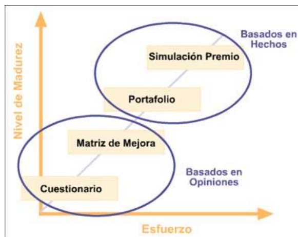
Figura 2. Métodos autoevaluación

La figura 2 muestra esta relación entre la herramienta de evaluación por utilizar, el grado maduro es de la organización y la dificultad que conlleva el uso de la propia herramienta.